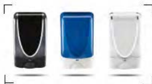
Seifenspender- und Handdesinfektorspender

Ihr Fachgroßhändler für: Spendersysteme und Zubehör wie Handluchtpapier, WC-Papier, Seife, Handdesinfektionsmittel, Urinale etc.